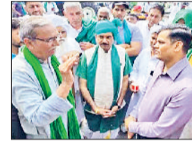
एसडीएम से बातचीत करते हुए किसान।

गांव सोहाना के समीप भारतीय किसान यूनियन के तत्वावधान में चल रहा धरने को करीब एक माह होने जा रहा है लेकिन प्रशासन के कान पर जूं तक नहीं रेंगी। आज भाकियू के विरोध प्रदर्शन के दौरान