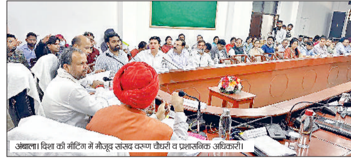
अंबाला। दिशा की मीटिंग में मौजूद सांसद वरुण चौधरी व प्रशासनिक अधिकारी।

सरकार की योजनाओं का हर नागरिक को मिलना चाहिए लाभ, अधिकारियों को दिए जरूरी निर्देश