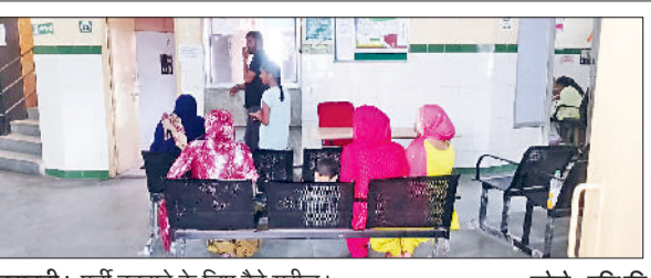
तरावड़ी। पर्वी बनवाने के लिए बैठे मरीज।