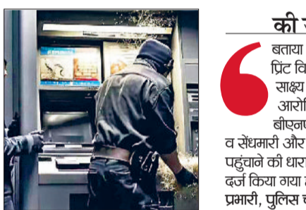
हरिभूमि न्यूज ▶▶ अंबाला

■ कैश मशीन की बजाय ढाई लाख का प्रिंटर ले गए ■ अंबाला के कोर्ट रोड स्थित बैंक ऑफ बड़ोदा के एटीएम कक्ष को बनाया निशाना