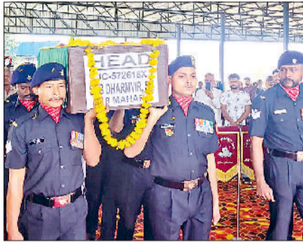
अंबाला। सेना के जवान शहीद सूबेदार के पाथिब शरीर को लेकर आते हुए व सलामी देते हुए जवान।

सिविकम में इयूटी के दौरान लापता हो गए थे सूबेदार