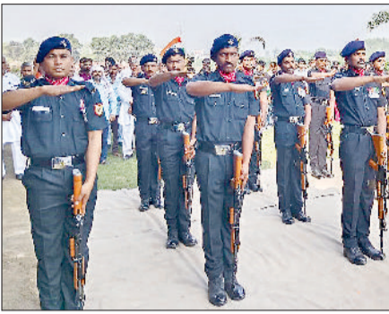
अंबाला। सेना के जवान शहीद सूबेदार के पाथिब शरीर को लेकर आते हुए व सलामी देते हुए जवान।

नमन किया। सेना की टुकड़ी ने हवा में गोलिएं दागकर सलामी दी। साबापुर के साथ-साथ आसपास के